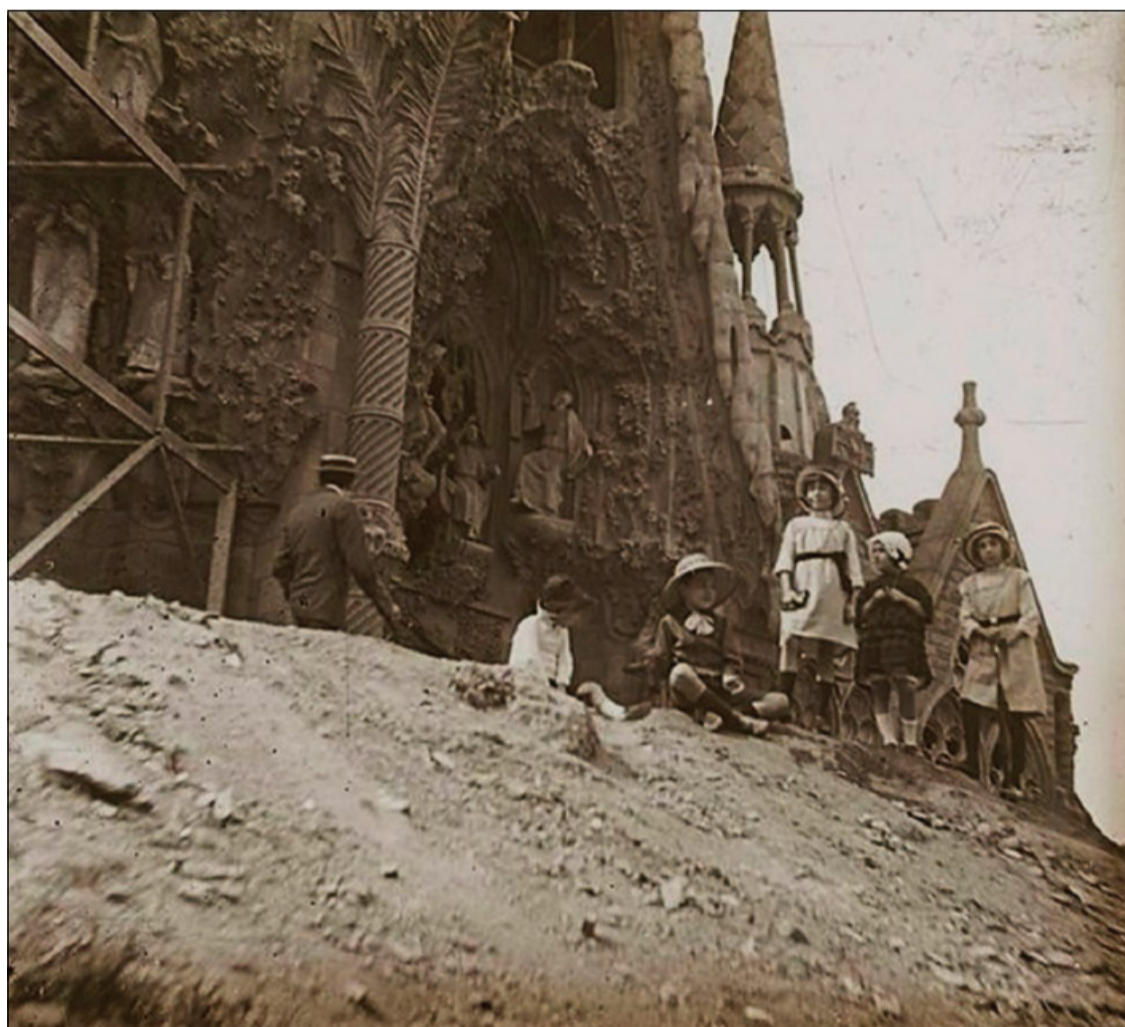
In alto e in basso a sinistra, bambini in visita alla Sagrada Familia (rispettivamente 1922 e 1922-1925)

Il criterio è molto chiaro e si applica anche letteralmente: alcune visite si svolsero costeggiando il muro esterno, da dove era comunque possibile vedere l'opera. Men-