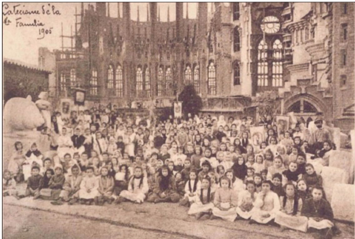
Sopra, foto di gruppo dell'associazione «Catequismo de la Família» (1905) Sotto, altri bambini in visita al tempio espiatorio catalano (1920)

Dopo la visita alla Sagrada Família, un bambino scrisse: «Di tutte le cose che ho visto, cosa potrei dire? Tutto molto bello e molto grande. Ed io mi sono sentito troppo piccolo, per descriverne la bellezza e la grandezza».