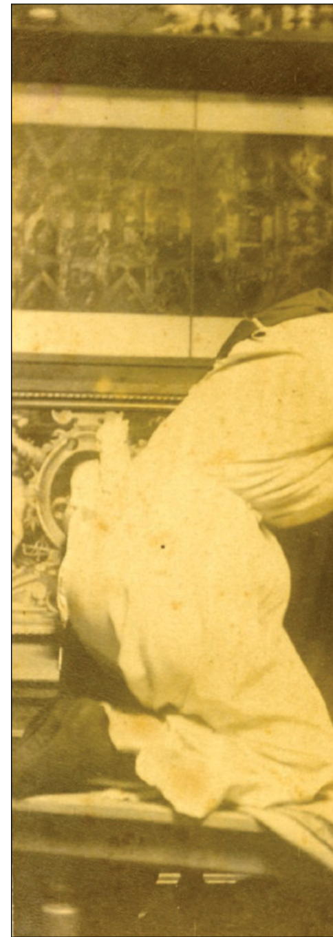
Sopra, «Domestica posando» (copyright Moser) Sotto, Giuseppe che consola il bambino Gesù (copyright Moser)

Barcellona come Londra, Manchester, Birmingham, Zurigo, Lione, New York, Detroit, Chicago. Città in grande espansione grazie al progresso indotto dalla Seconda