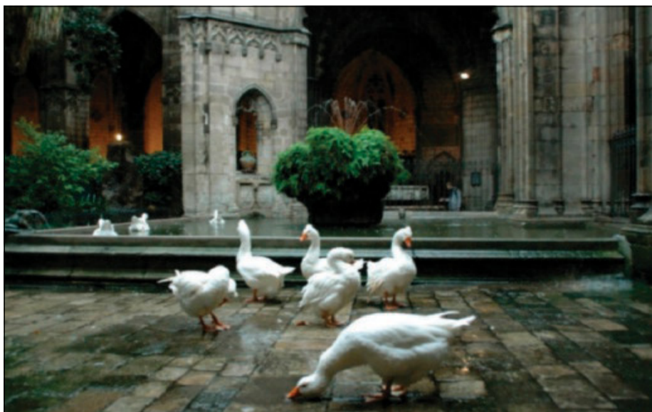
Le oche di santa Eulalia nel chiostro della cattedrale di Barcellona

ideali utopici. A cavallo di due mondi. Da un lato, la società borghese che si godeva la Belle Époque. Dall'altro, l'umanità del proletariato urbano e contadino. Uomini, donne, bambini abbandonati alla cupidigia del capitale.