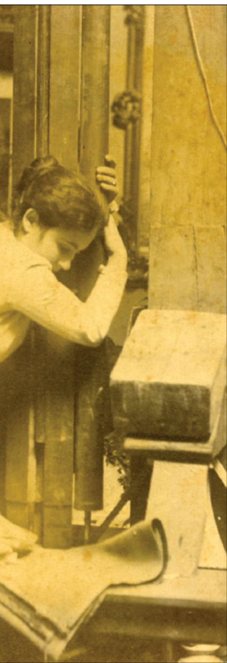
à Vidal, Enric. Arxiu Municipal de Barcelona). Portale della Speranza della Sagrada Família)