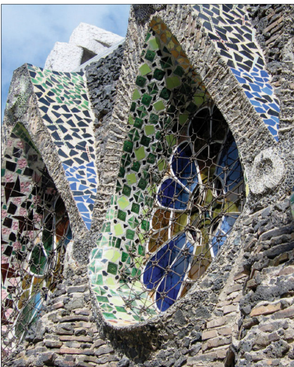
In alto, trencadís Casa Batlló In basso a sinistra, vetrate esterne della cripta Güell. In basso a destra, il tetto della Casa Batlló

nuova vita attraverso il trencadís , emerge una profonda lezione: anche il dolore, concepito dentro un disegno più grande, può acquisire un significato. Nelle mani di Gaudí, i frammenti non sono scarti, ma elementi essenziali per costruire una bellezza che non nega la sofferenza, ma la redime, trasformandola in una forma di vivere dove ogni pezzo rotto trova il suo posto in un mosaico che un altro ha disegnato.