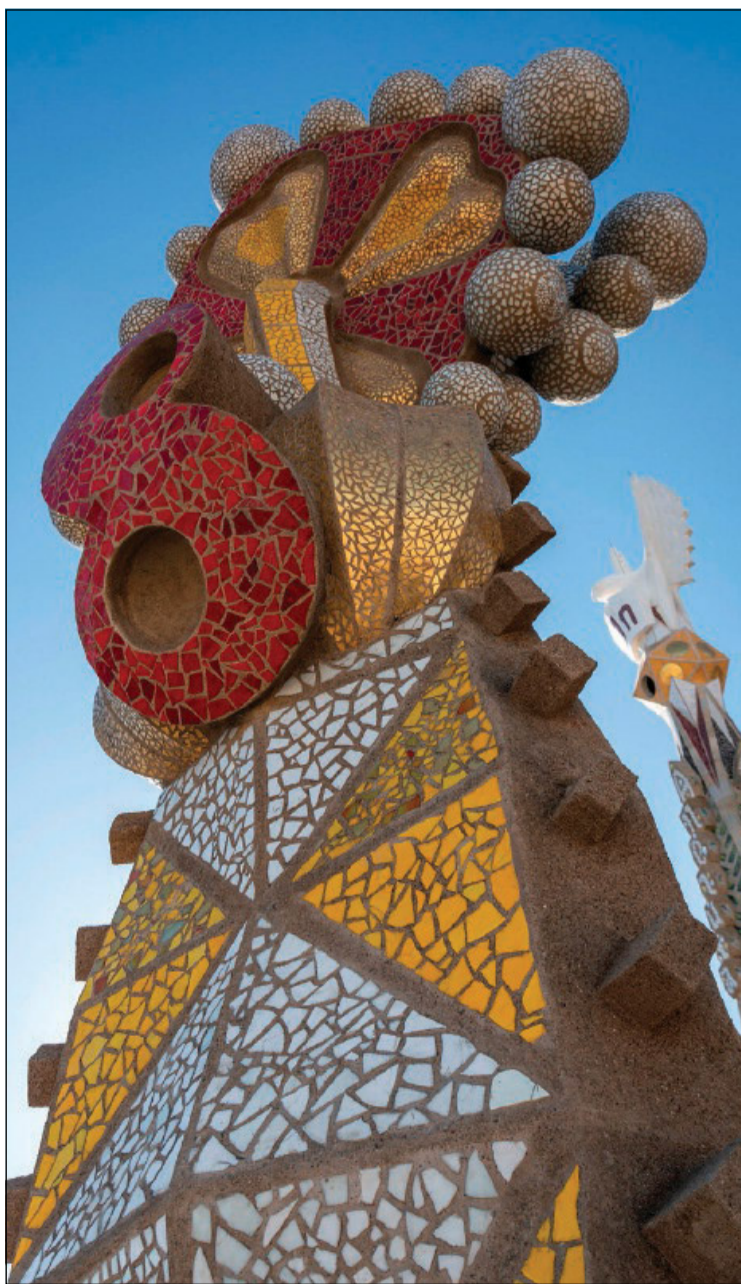
Torri perimetrali della Sagrada Família

Autore di diverse opere nella Sagrada Família di Barcellona – dove in particolare ha usato il trencadís per la frutta sui pinnacoli – lo scultore giapponese Etsurō Sotoo è tra i vincitori del Premio Ratzinger 2024, insieme al teologo irlandese Cyril O'Regan; la consegna avverrà il prossimo il 22 novembre nella Sala Regia del Palazzo Apostolico dalle mani del cardinale segretario di Stato, Pietro Parolin. La storia di Sotoo – nato a Fukuoka (Giappone) nel 1953 e laureato in Belle Arti all'università di Kyoto – non è legata solo alla passione per l'arte, ma è anche una storia di conversione. Nel 1978, infatti, visitando Barcellona, restò estremamente colpito dalla Basilica della Sagrada Família, al punto da chiedere di lavorare come scultore; cominciò dalla facciata della Natività, seguendo le indicazioni lasciate da Antoni Gaudí. È proprio durante questo periodo che si convertì al cristianesimo, ricevendo il battesimo. Le opere principali di Sotoo sono presenti in varie parti del tempio espiatorio di Barcellona, ma anche in altre località della Spagna, in Giappone e in Italia, dove nel 2015 ha realizzato l'ambone della cattedrale di Firenze, Santa Maria del Fiore. È il primo asiatico e il primo scultore a essere insignito del Premio Ratzinger.