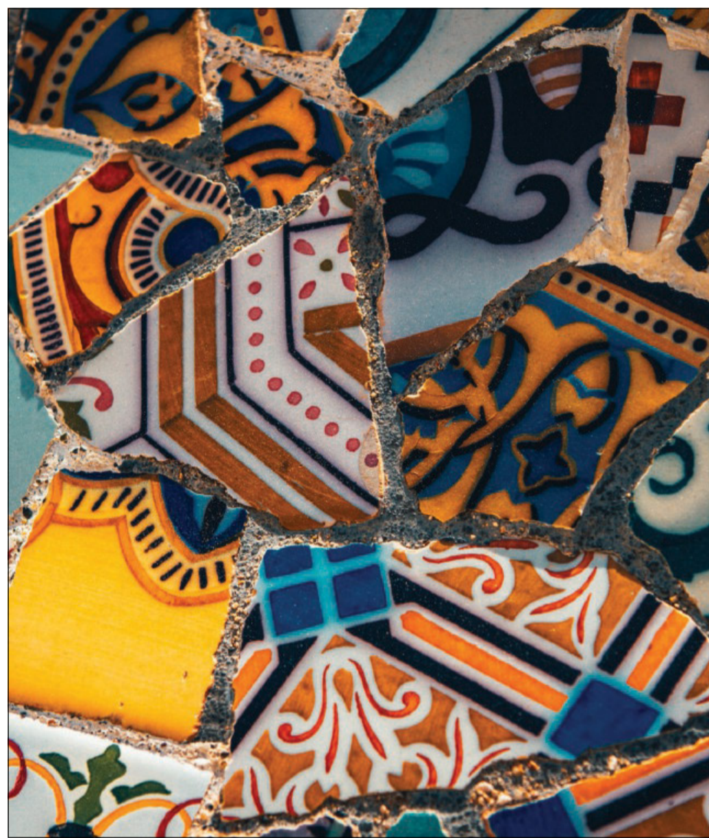
Particolare del mosaico realizzato con frammenti di ceramica, Park Güell

Quella di Gaudí è un'arte personale che, oltre all'estetica, ha saputo introdurre una novità tecnica che immediatamente diventò l'emblema della città: il trencadís , un mosaico caratterizzato dall'uso di frammenti di ceramica, vetro o pietra, ma anche oggetti di diverse forme e colori. Una composizione dal carattere grezzo. La dimensione dei tasselli, superiore a quella tradizionale, conferisce alle opere un caratteristico aspetto estetico, organico e dinamico. Infatti, al contrario del mosaico, che può essere utilizzato unicamente in aree piane, il trencadís di Gaudí può rico-