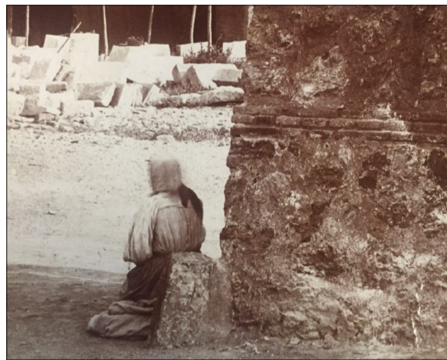
Una donna chiede l'elemosina davanti all'ingresso della Sagrada Família (1918)

mula semplice e tangibile di pietà che è propria del senso religioso dell'uomo sin dal Paleolitico. Chi afferma che la vera elemosina non consiste nel dare soldi non ha tutti i torti; infatti, la vera elemosina è dare ciò di cui l'altro ha bisogno. Se il bisogno è economico l'elemosina sarà in beni secondo