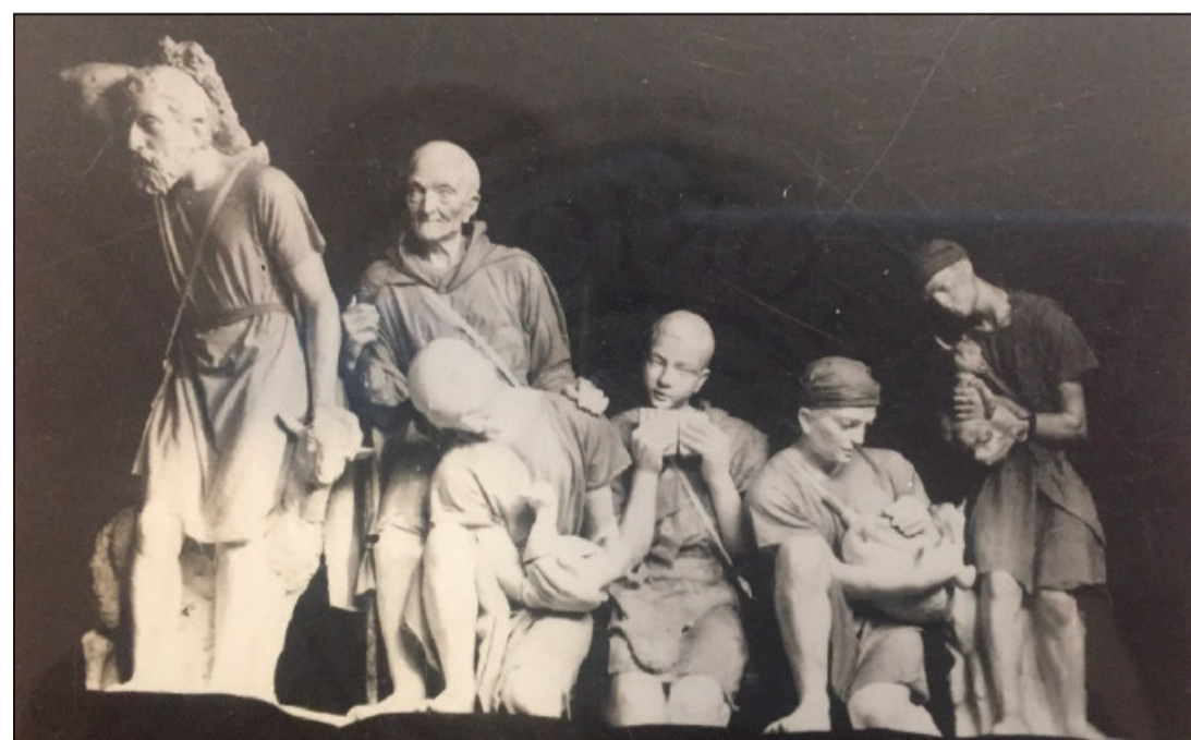
Modellino in gesso dell'Adorazione dei pastori che portano doni al bambino Gesù

Le chiese espiatorie sono effettivamente il segno tangibile che l'elemosina è una forma superiore della vita sociale perché è capace di unire gli uomini nello spazio e nel tempo. E di unire la volontà umana con la volontà divina.